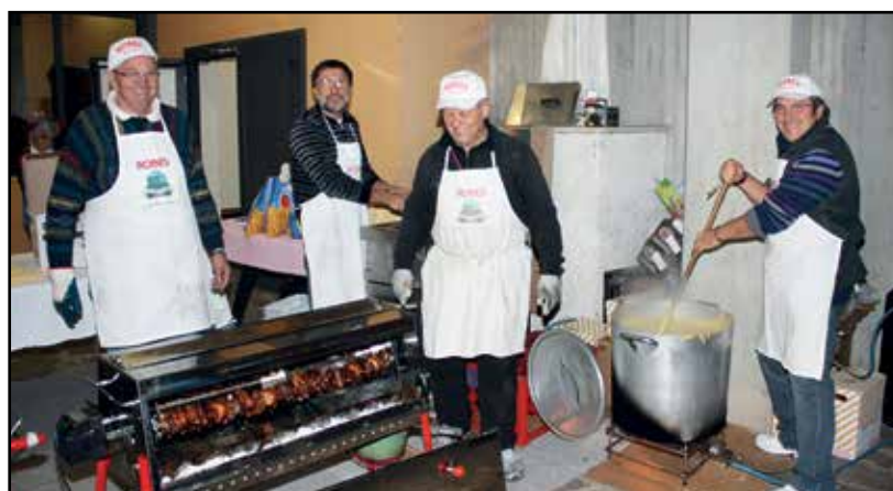
Cucineri di una edizione del passato.

Questo incontro si svolgerà domenica 26 febbraio alle ore 12,30 presso il Centro Giovanile . Verrà servito lo spiedo con polentina ed intingolo, patatine