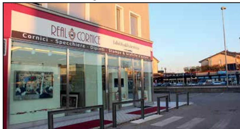
L'ingresso della nuova Galleria d'Arte in Viale Europa.