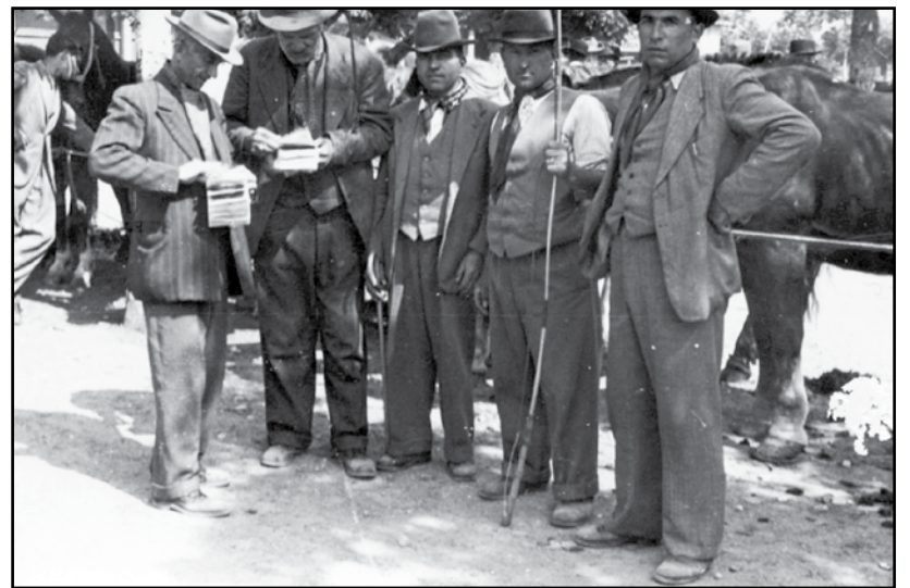
Dimenticare il passato non aiuta certo il futuro.